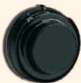
Fecho de Combinação